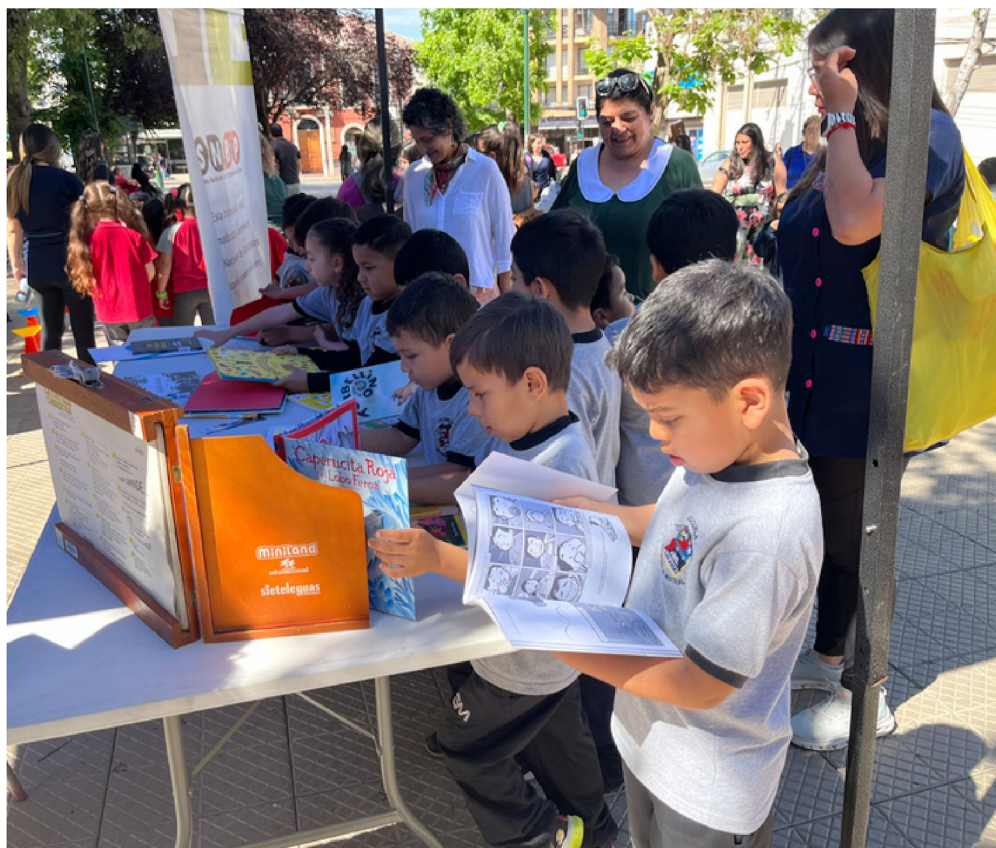
En Los Andes celebraron masivamente el Día Mundial de la Infancia