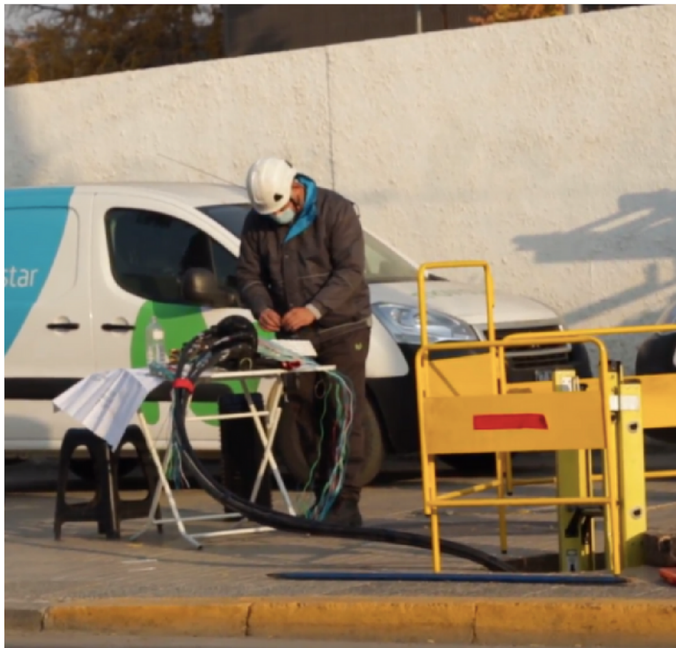
“Conectemos Chile”: proyecto inauguró fibra óptica y 5G en la comuna de Panquehue