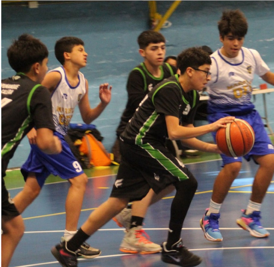
Arrancan los Juegos Deportivos Escolares del IND 2024 en el Valle de Aconcagua