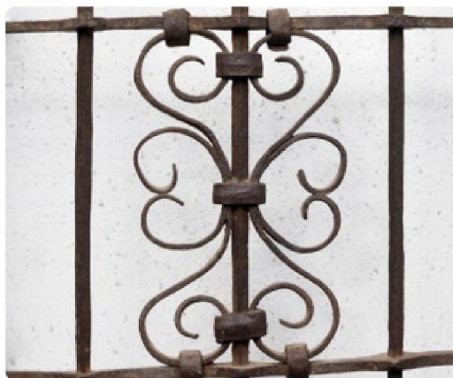
Detalle Reja de Ventana. MHSF 15009.