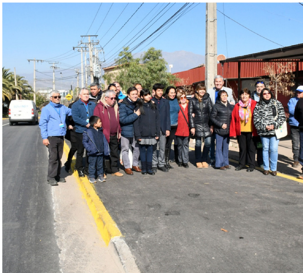
Entregan obras de pavimentación de Avda. Pascual Baburizza en Los Andes