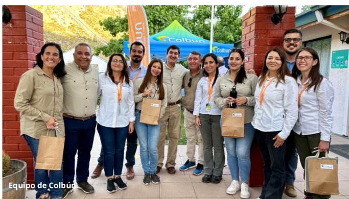
Equipo de Colbún